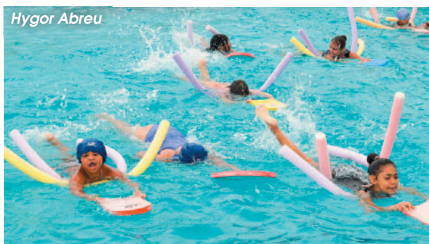
Inscrições acontecem a partir desta segunda-feira (13), somente no Caec João Paulo II, que fica no Pae Cará, em VC

Mas não para por aí. A população pode escolher, ainda, entre balé clássico e contemporâneo, dança expressiva e de salão, jazz e teatro. Por fim, ao ar livre são disponibilizadas vagas para futsal