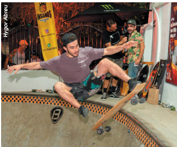
2ª etapa do Circuito Guarujense de Esportes Radicais aconteceu no último sábado (6), no Tombowl Park

“A 1ª fase já tinha sido uma surpresa e essa conseguiu superar, tanto de público quanto de atle-