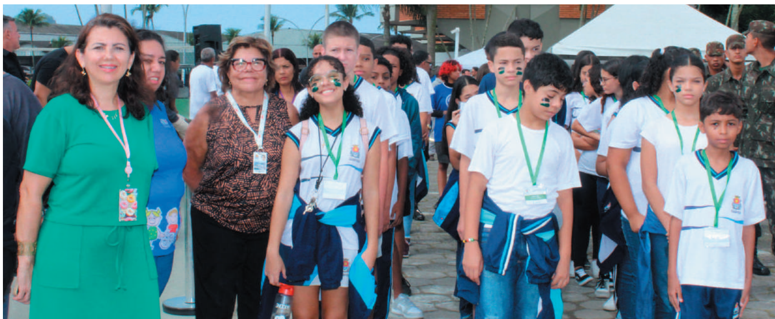
Crianças de escolas municipais participaram do evento