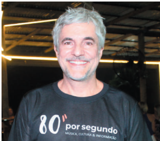
O ator, apresentador e DJ Rodrigo Veronese desafiou a galera com grandes sucessos dos anos 80, no Dolores Bar, na Praia da Enseada. O público participou dançando em grupo as músicas do passado. Vale repetir o show. Parabéns!