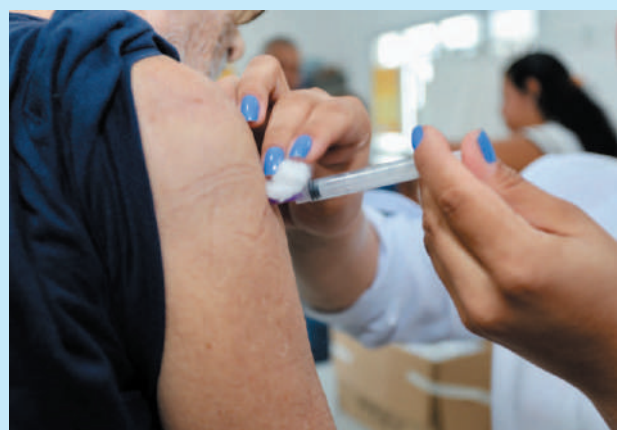
A imunização foi liberada para todos os públicos no dia 3 de maio

“Para a ampliação do público a ser imunizado, o Município depende das orientações do Ministério Saúde. As doses da Spikevax chegaram ao Município nesta semana e estão sendo distribuídos nas unidades”, informa a prefeitura.