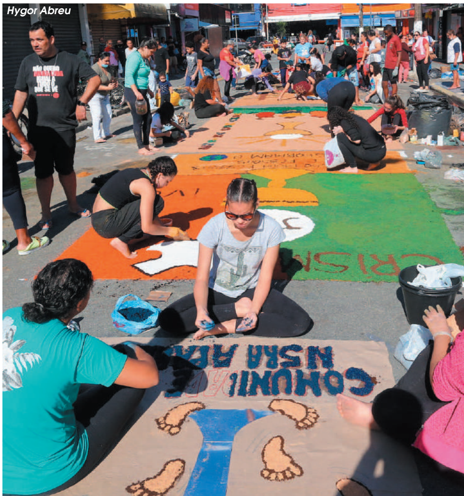
Igrejas celebram a data com confecção de tapetes e missas