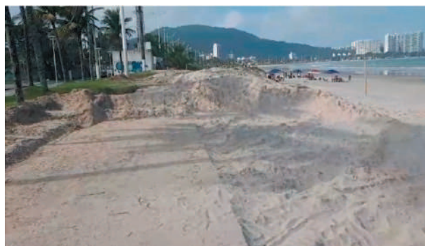
Extração de Areia é exemplo de infração da legislação ambiental

As dunas e os jundus, mata de baixa estatura, típica de praias da Baixada Santista e de regiões praianas, são barreiras naturais e indicam a regeneração ambiental. A função das dunas é de