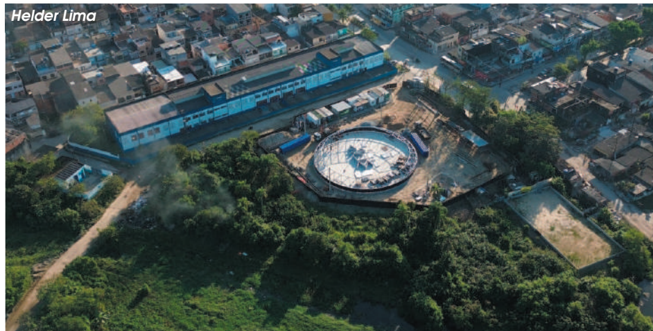
Abastecimento será feito pela Estação Elevatória de Água Tratada, que será construída dentro da área do reservatório

Neste momento, é realizada a montagem de estrutura metálica, com domus (teto) e paredes de aço vitrificado. O investimento é de mais de R$ 15,7 milhões e as obras, a cargo da Companhia de Saneamento Básico do Estado de São Paulo (Sabesp), são acompanhadas pela