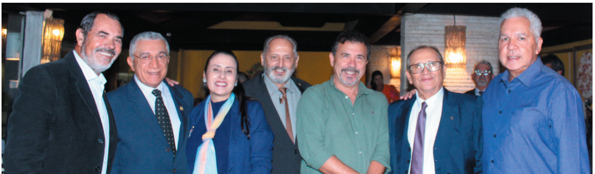
Sócios fundadores do Rotary Club Guarujá Vicente de Carvalho