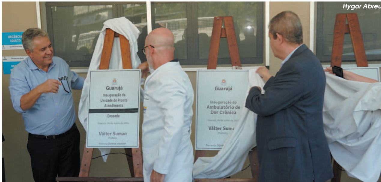
Novo equipamento funcionará, provisoriamente, dentro das instalações da Universidade de Ribeirão Preto (Unaerp) – campus Guarujá, na Enseada

O atendimento à população já começa nesta segunda-feira (1º), a partir das 8 horas. A iniciativa é fruto de uma parceria entre a Secretaria Municipal de Saúde (Sesau) e a instituição de ensino, por meio do contrato organizativo de ação pública de ensino-saúde (Coapes).