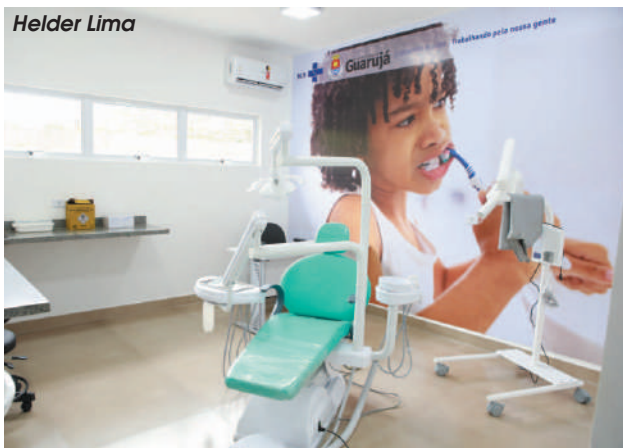
Equipamento já atende os pacientes encaminhados pelas Usafas e UBS