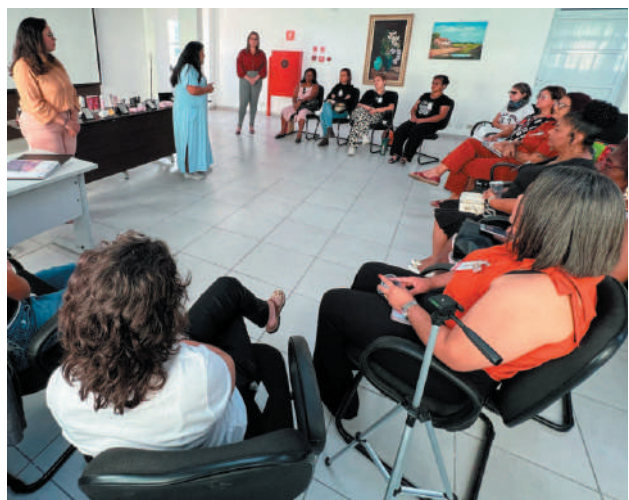
Curso oferece oportunidade para promover justiça social e igualdade

A 17ª Turma do Curso de Formação das Promotoras Legais Populares está com inscrições abertas até o dia 26 de julho. Este curso é destinado a mulheres interessadas em fortalecer seus conhecimentos sobre direitos e cidadania, além de atuar como agentes de transformação social em suas comunidades.