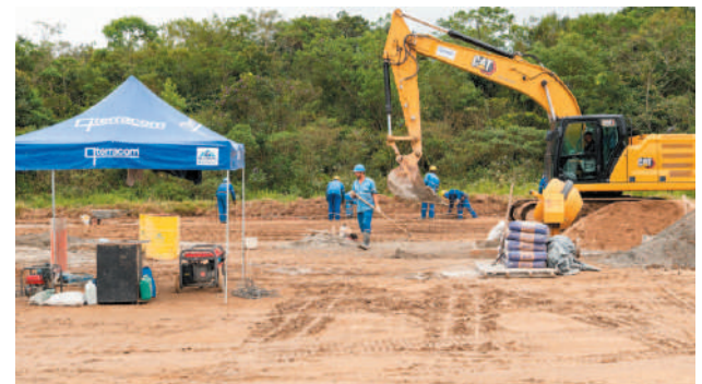
Obras têm investimentos de R$ 19 milhões

geiros, atualmente em fase de licitação, terá 300 m², acesso e estacionamento. Com custo de R$ 3,5 milhões e execução prevista em cinco meses, permitirá operações de aeronaves para até 72 passageiros.