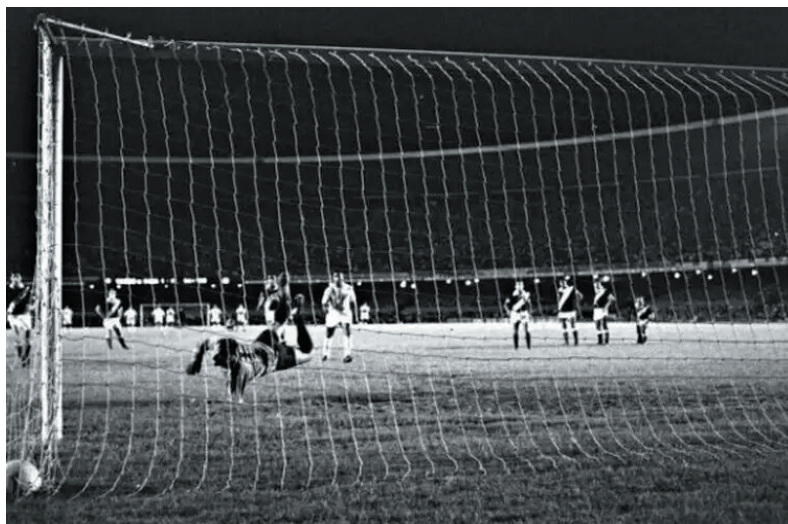
O milésimo gol de Pelé foi em um Maracanã lotado

Toda a imprensa brasileira e jornalistas estrangeiros já haviam reservado os espaços no estádio para acompanhar de perto o feito inédito de um jogador de futebol atingir a marca dos mil gols. E esse jogador era Pelé, o Atleta do Século.