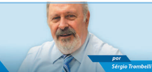
por Sérgio Trombelli