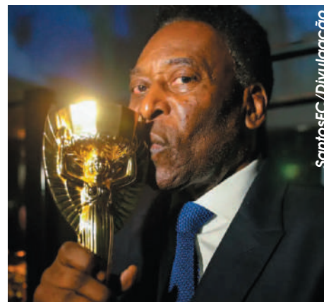
Nessa data, o maior camisa 10 da história do futebol de todos os tempos marcou seu milésimo gol

O pênalti aconteceu aos 33 minutos, quando Pelé foi derrubado na área, após receber um passe de Clodoaldo. Manoel Amaro não teve dúvida e apontou para a marca de cobrança da penalidade.