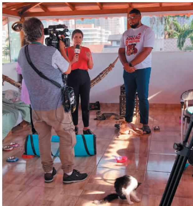
Projeto reconhece animais domésticos como seres sencientes, regulamenta comércio e proteção contra os abusos

Os filhotes só podem ser vendidos ou trocados