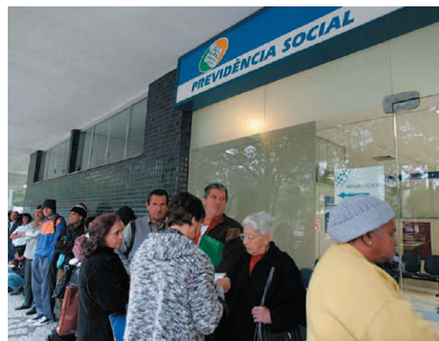
Pauta é sobre reajuste salarial; Instituto tem 19 mil funcionários ativos no quadro

Os servidores do Instituto Nacional do Seguro Social marcaram