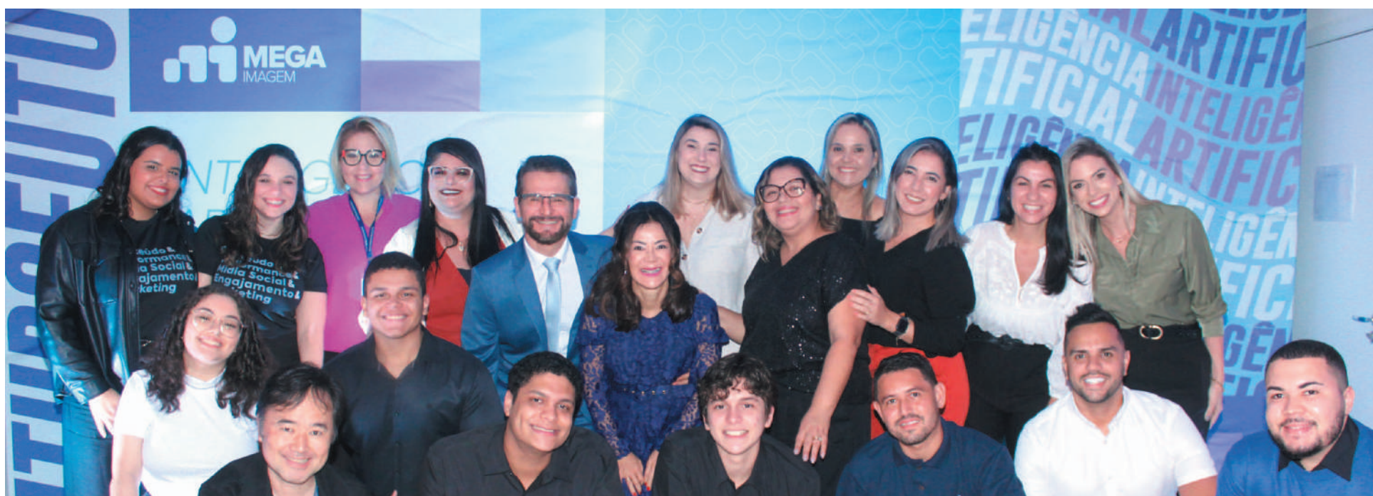
A equipe de colaboradores da Mega Imagem