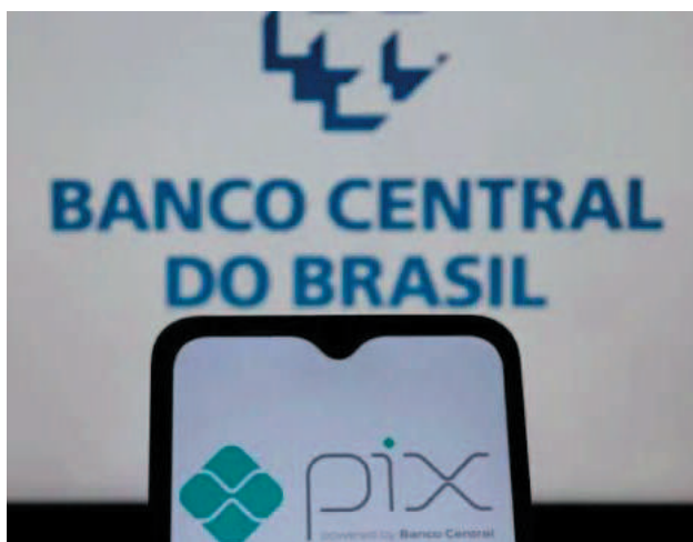
Dados protegidos pelo sigilo bancário não foram expostos

tou o BC, ocorreu por causa de falhas pontuais em sistemas da instituição de pagamento. A exposição, informou o BC, ocorreu em dados cadastrais, que não afetam a movimentação de dinheiro. Dados protegidos pelo