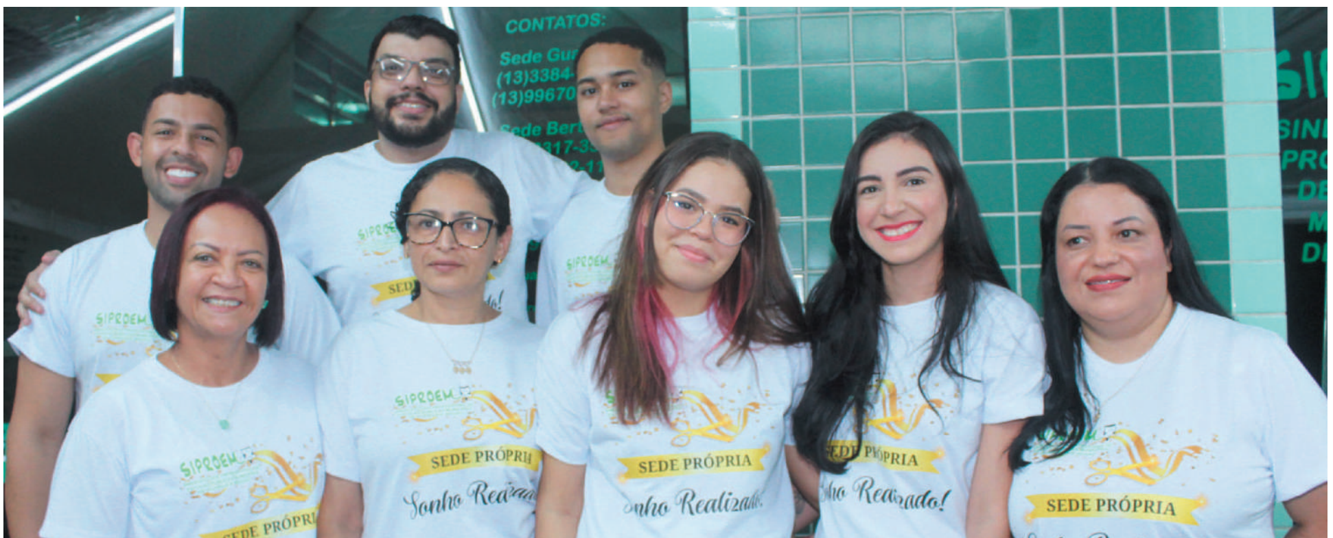
Equipe de colaboradores, felizes com o novo espaço