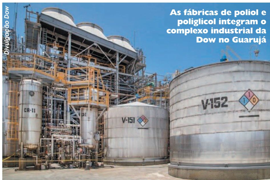
As fábricas de poliol e poliglicol integram o complexo industrial da Dow no Guarujá

Em 2022, a Dow decidiu modernizar seu sistema de refrigeração industrial, que opera há quase 20 anos. “Esses compressores têm a função de refrigerar os diversos reatores químicos usados nos