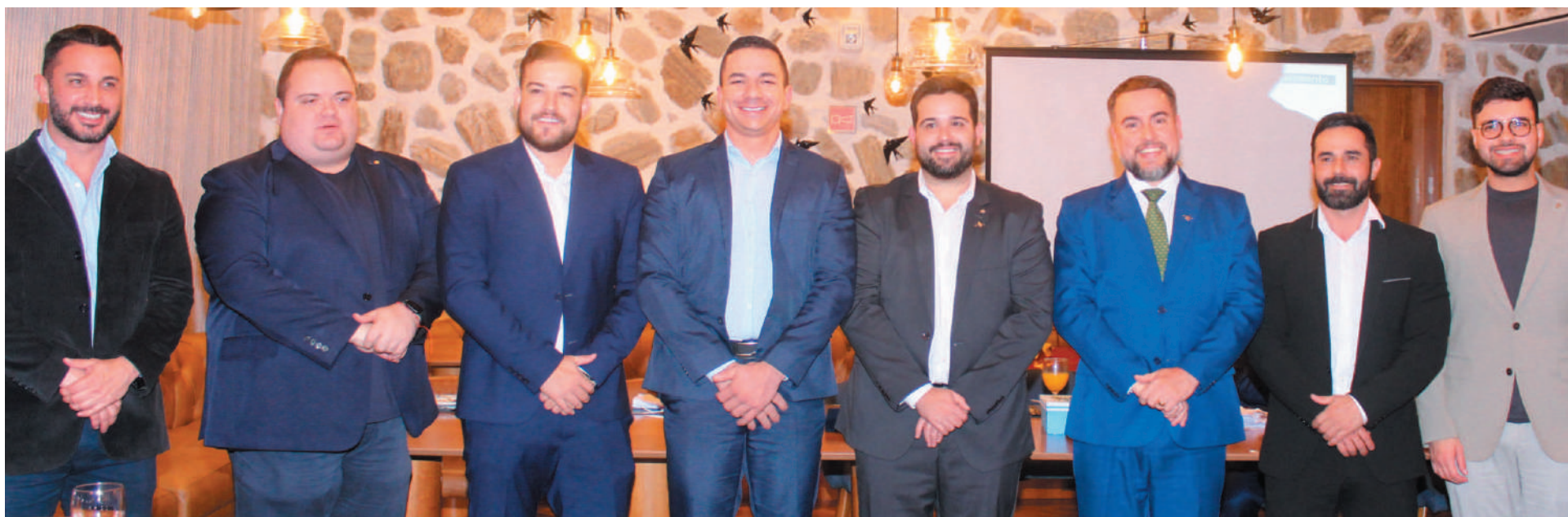
Amigos que prestigiaram os homenageados