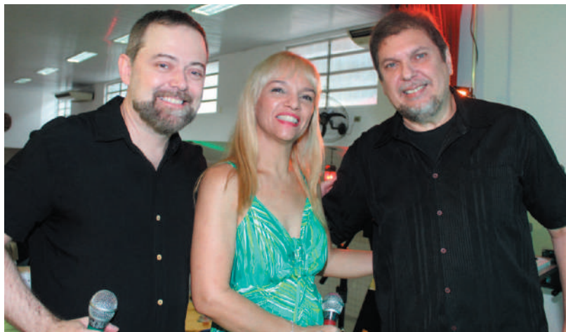
Componentes da Banda Imagem