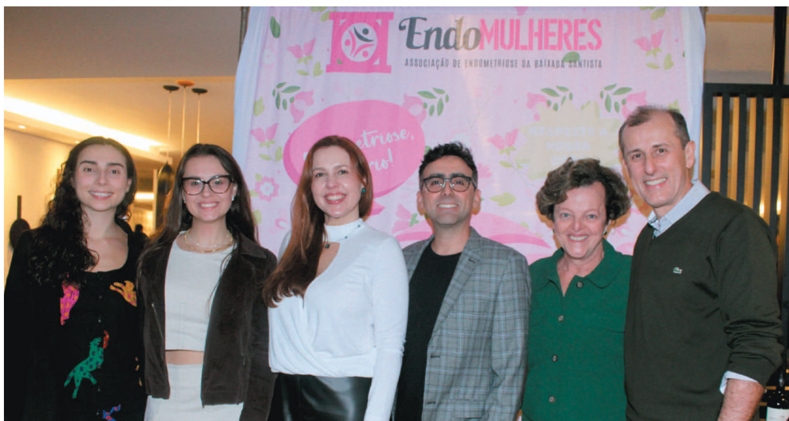
Profissionais da Saúde que dão apoio à instituição