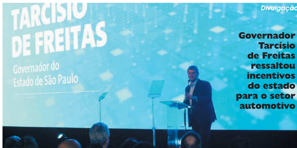
Governador Tarcísio de Freitas ressaltou incentivos do estado para o setor automotivo

Tarcísio também lembrou outros incentivos para esse momento de transição energética.