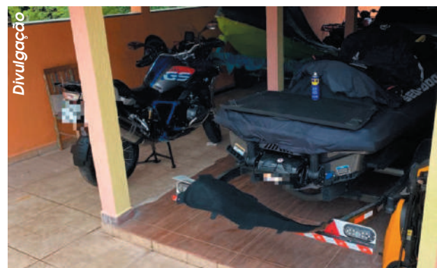
Na chamada Operação Ctrl C, polícia fecha central de golpe que funcionava em casa de praia; suspeito clonava páginas de vendas de ingressos

Os agentes da 3ª Delegacia da Divisão de Crimes Cibernéticos (DC-Ciber), realizaram a Operação Ctrl C — comando usado em computadores para copiar informações — e cumpriram mandado de busca no local. Durante as investigações, foi identificado que o suspeito clonava páginas de vendas de ingressos e, para não ser