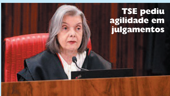
TSE pediu agilidade em julgamentos

Na sessão de terça-feira (24), a presidente do TSE, ministra Cármem Lúcia, destacou que a Justiça Eleitoral não tolera violência política. Ela encaminhou ofícios à Polícia Federal, ao MPF e aos TRs pedindo agilidade na investigação e julgamento de atos contrários ao Direito Eleitoral e à cidadania.