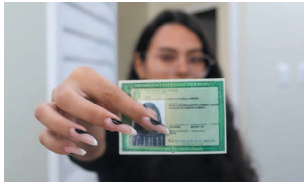
A Justiça Eleitoral aceita documentos oficiais com foto para comprovar a identidade da eleitora ou do eleitor

Mais de 155 milhões de eleitoras e eleitores em 5.569 municípios estão aptos a votar para os car-