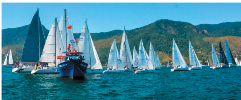
Tradicional competição oferecerá benefícios às tripulações que também correrem a Santos-Rio

A principal novidade deste ano são os benefícios concedidos às tripulações que competirem tanto na Regata dos Arvoredos quanto na Santos-Rio, marcada para