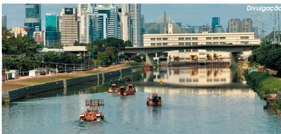
Proposta foi aprovada na Alesp por ampla maioria dos votos

A proposta do Governo de SP foi aprovada na Alesp no início deste mês, por ampla maioria dos votos (60 favoráveis). Com as novas regras, o rol de atuação da Artesp e Arseps foi ampliado, além de transformar o Departamento de Águas e Energia Elé-