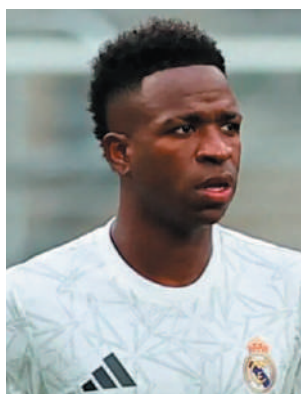
Torcedor cometeu as ofensas durante jogos da La Liga, em 2023

As ofensas contra Vinicius Jr foram capturadas pelas câmeras da emissão-