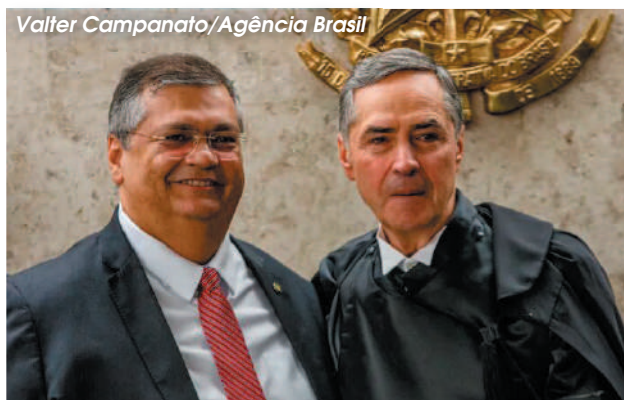
Flávio Dino, Ministro da Justiça, e Luís Roberto Barroso, presidente do Supremo Tribunal Federal (STF)

“Uma coisa que me chamou a atenção foi a perda de credibilidade de quem atacava a credi-