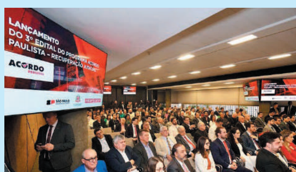
Notificação inclui 307 veículos com um total de R$ 784.935,62 em débitos

Os pagamentos podem ser feitos online ou em agências bancárias credenciadas, usando o serviço de autoatendimento e informando o número do Renavam do veículo. Também é possível pagar via Pix, acessando a página do IPVA no portal da Sefaz-SP, gerando um QR