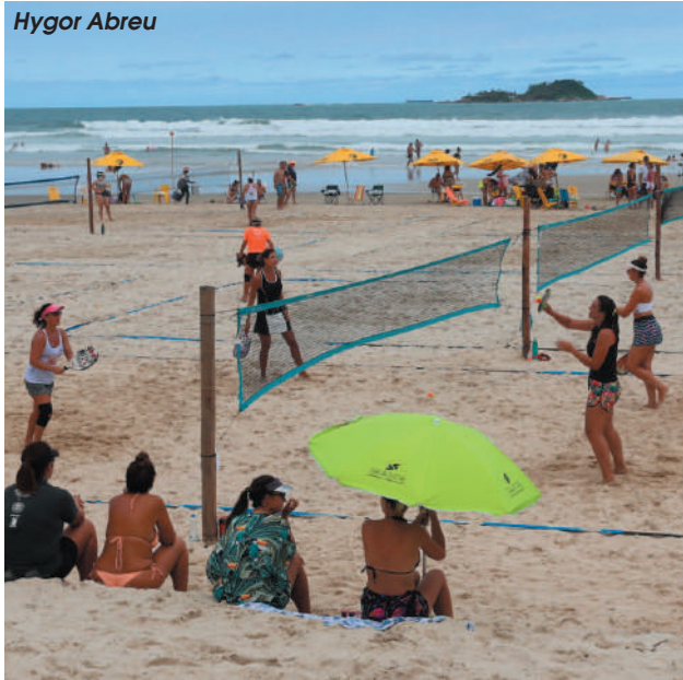
Guarujá recebe quatro eventos esportivos de sexta a domingo