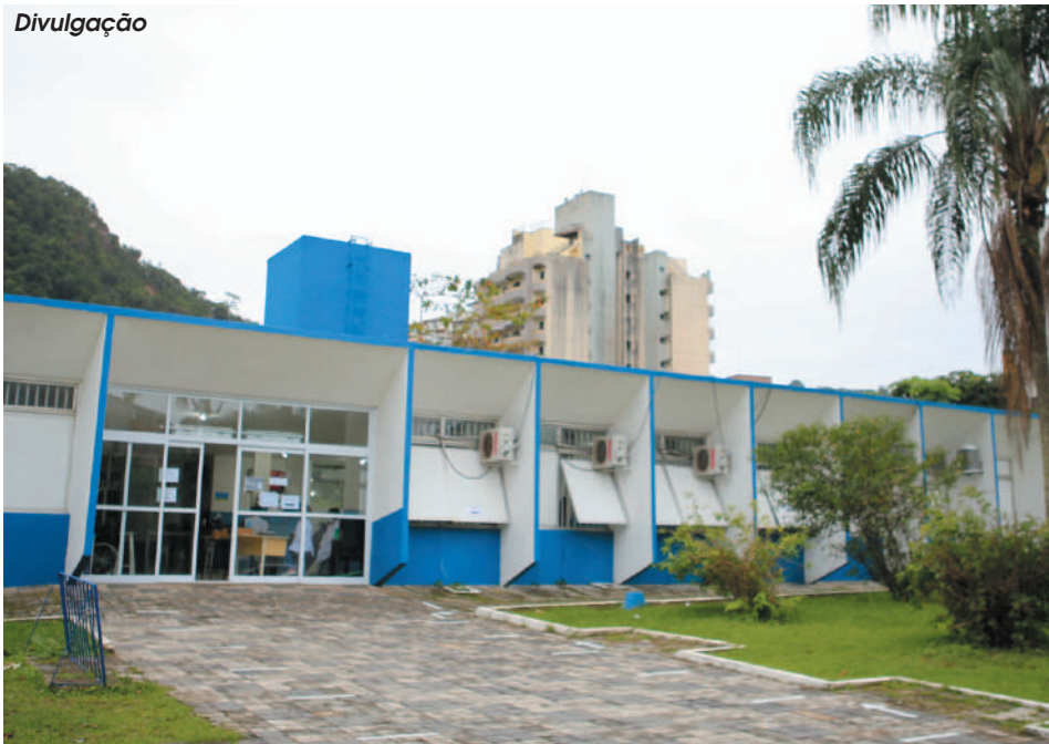
Prefeitura organiza mutirão de otorrinolaringologia no ARE da Vila Júlia. Pré-agendados serão atendidos nesta quarta (20), sábado (23) e domingo (24), das 8h às 18h