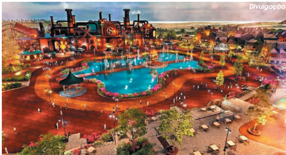
Projeto da entrada do Cacau Park, em Itu (SP)

O parque ficará num terreno de 7 milhões de metros quadrados, no KM 84 da rodovia Castello Branco, na divisa entre Itu e Sorocaba. Desses, 950 mil metros quadrados serão de área construída, sendo que em 400 mil metros estarão atrações inéditas no Brasil.