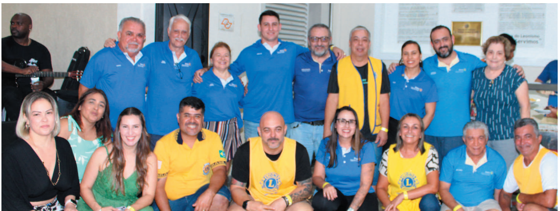
Rotary Club Guarujá Vicente de Carvalho e Lions Clube Guarujá, uma parceria em prol da comunidade. O momento contou com o convívio de união reforçando o espírito de solidariedade.