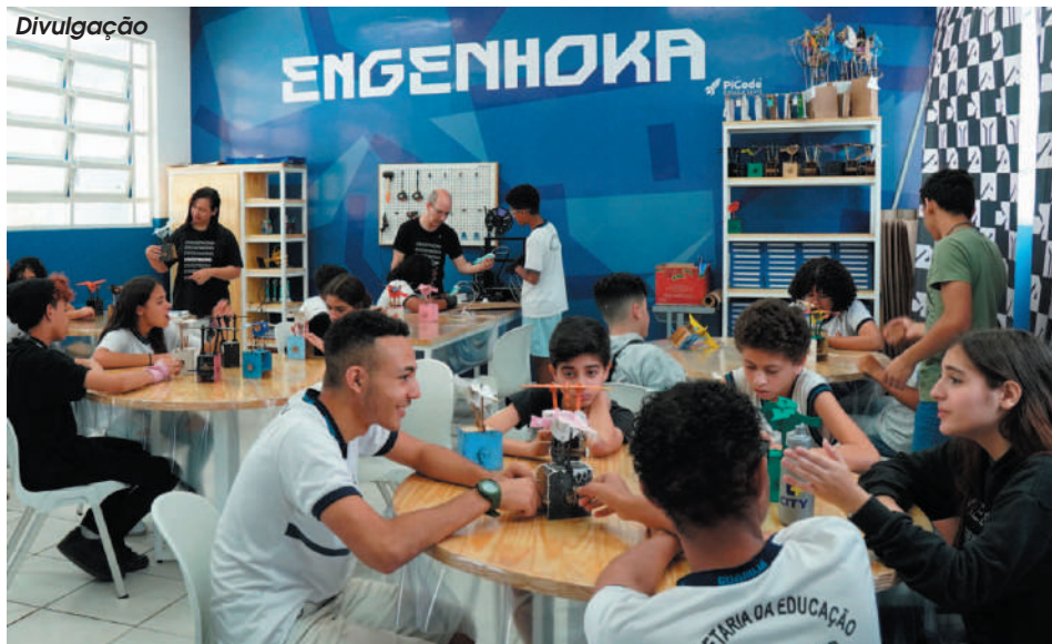
Alunos do Jafet participaram do projeto com recursos pedagógicos, tecnológicos e artísticos

módulos, os participantes exploraram desde conceitos de artistas como Leonardo da Vinci e Lygia Clark até a produção de objetos como esculturas interativas, luminárias criativas e autômatos.