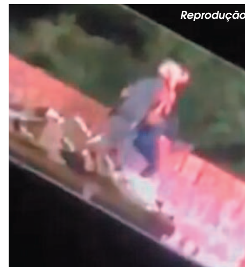
O pedido de prisão foi feito pela Corregedoria da PM