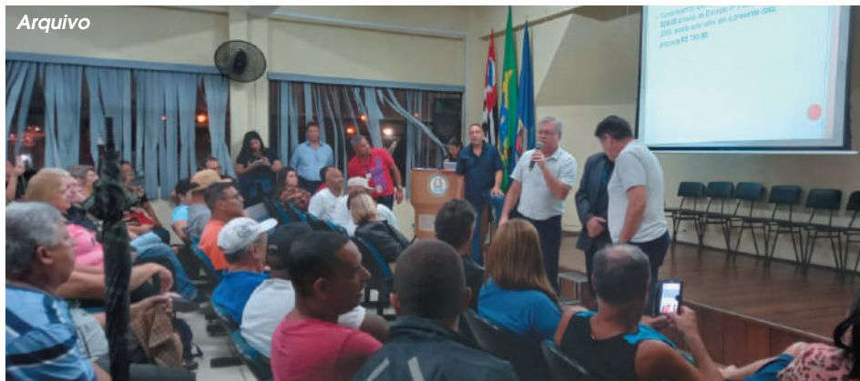
Sindserv Guarujá inicia campanha salarial com consulta aos servidores nos dias 16, 17 e 18 de dezembro

Segundo o presidente do Sindserv, Zoel Siqueira, as sugestões coletadas serão somadas às propostas da direção sindical e submetidas a uma assembleia em janeiro. "O objetivo é encaminhar o documento final ao prefeito eleito, Farid Madi (Podemos), para que as negociações comecem ainda em janeiro, garantindo que to-