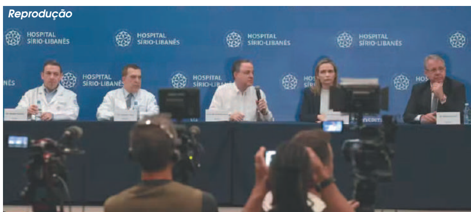
Presidente pode ter alta na semana que vem, diz médico

O enfrentamento da dengue, segundo a ministra, depende de esforços coordenados entre governos e cidadãos, ampliando a conscientização e o uso de tecnologias inovadoras para frear o avanço da doença.