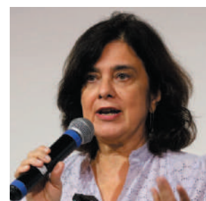
Ministra da Saúde, Nísia Trindade

A ministra defendeu um plano internacional para lidar com doenças transmitidas pelo Aedes aegypti , como zika e chikungunya, e destacou o desenvolvimento de tecnologias para controlar o mosquito. Embora ainda não haja um plano