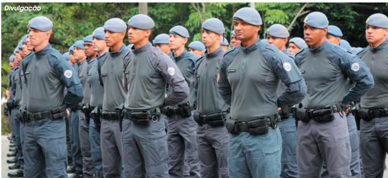
Entre as novidades estão dispositivos com acionamento remoto, integração com sistemas operacionais e ativação automática por Bluetooth

Entre as novidades estão dispositivos com acionamento remoto, integração com sistemas operacionais e ativação automática por Bluetooth. Os testes de validação