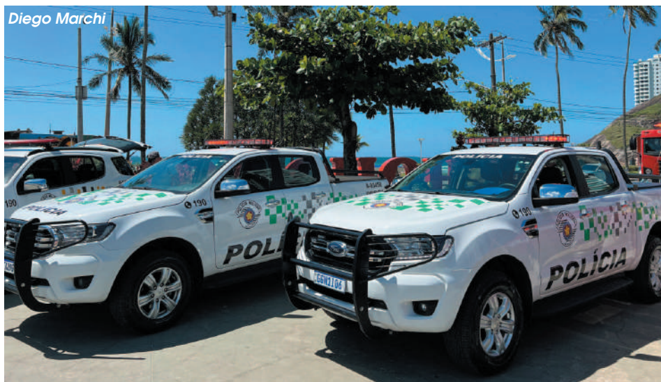
Município receberá o maior contingente da Baixada Santista e o efetivo será recepcionado na terça (17), no Procópio Ferreira

Os policiais vão atuar até a primeira semana de fevereiro nos locais de grande fluxo (praias, pontos turísticos) e nas áreas de interesse estra-