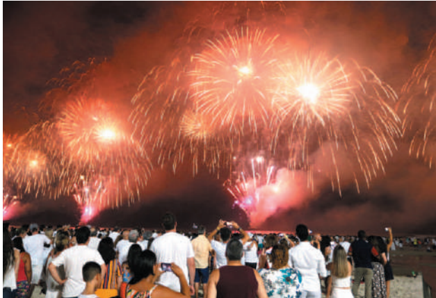
A atração é esperada por mais de 1,5 milhão de turistas na virada do ano

Um espetáculo de luzes e cores está preparado para encantar moradores e visitantes de Guarujá e Vicente de Carvalho na virada do ano, de terça (31) para quarta-feira (1º). Promovida pela Prefeitura de Guarujá, a queima de fogos terá 20 minutos de duração, celebrando a chegada de 2025 em grande estilo.