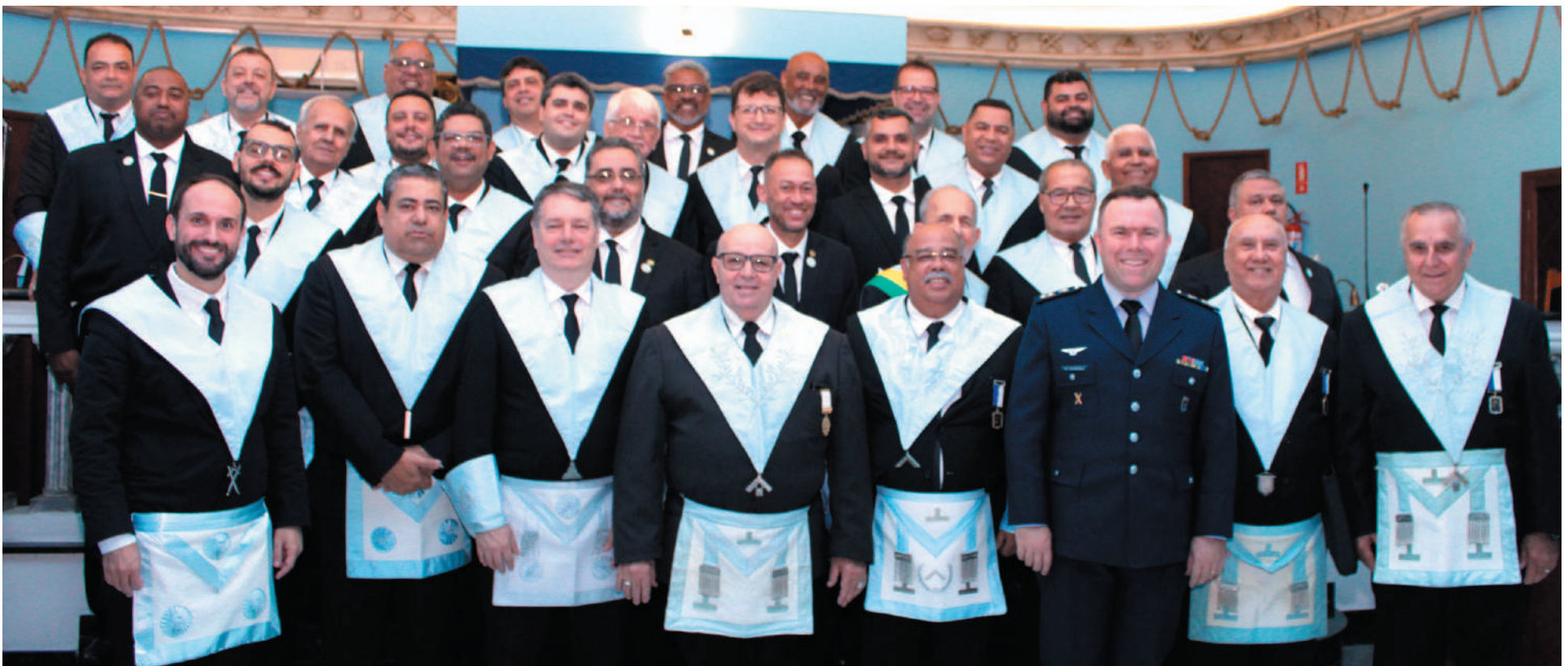
Os irmãos da loja Alberto Santos Dumont reunidos para a confraternização de 33 anos de aniversário