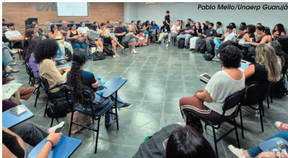
Estudantes de Medicina e Psicologia promovem debate sobre saúde mental na Unaerp Guarujá

O setor atua como um canal de acolhimento e suporte emocional, oferecendo orientação psicopedagógica para