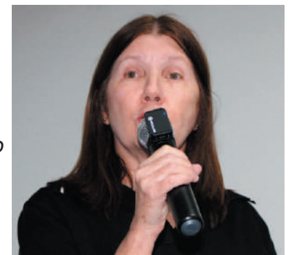
A engenheira civil e presidente do CREA/SP, Lígia Marta Mackey