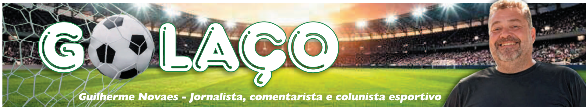
Guilherme Novaes - Jornalista, comentarista e colunista esportivo